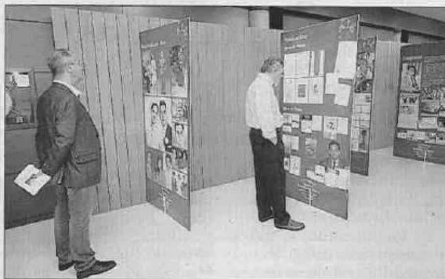
Paneles de la exposición instaladas en la biblioteca. | 13FOTOS