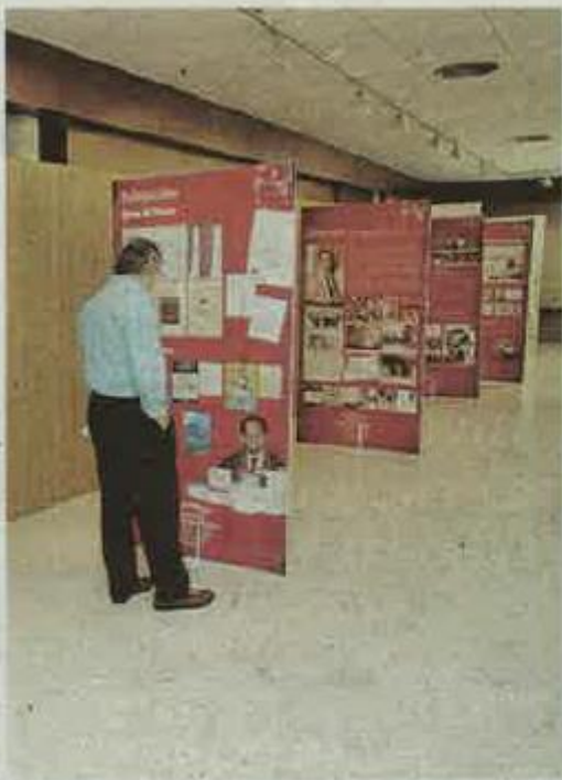
Paneles de la muestra. CÉSAR QUIAN